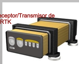
Sistema Receptor/Transmisor de corrección RTK