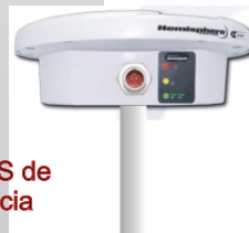
Antena GPS de Alta Ganancia