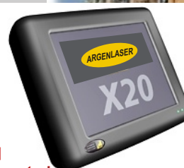
Pantalla Táctil Color con Computadora de a bordo.